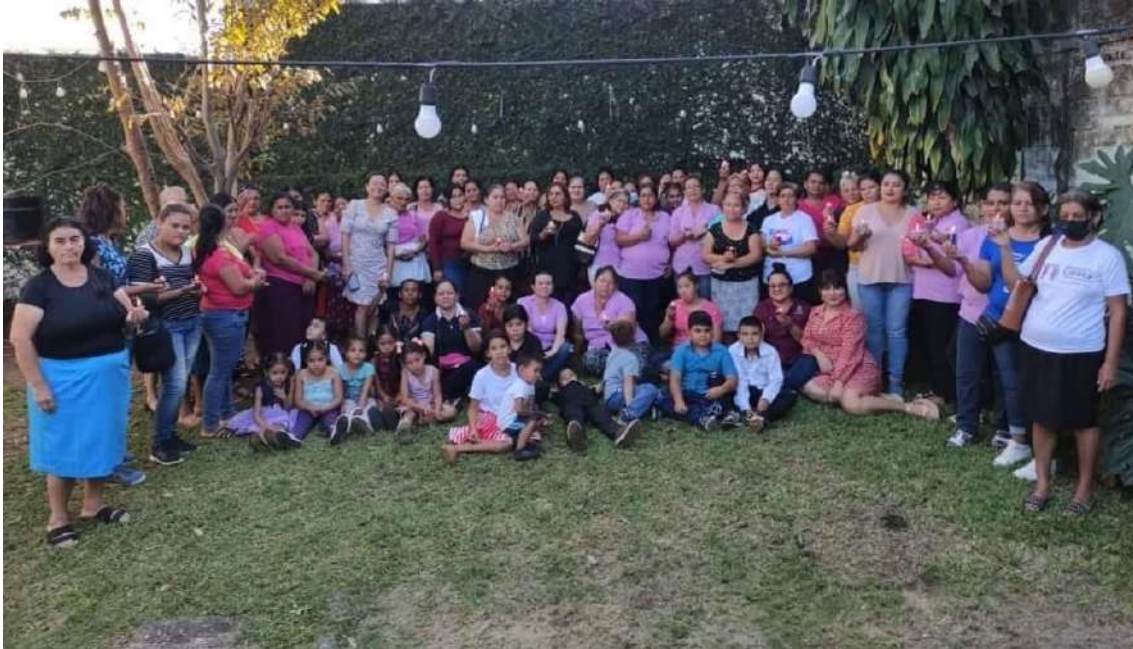
Asamblea general asociación de mujeres ADCMA

Objetivo 2: Contribuir al incremento de la participación política feminista de las mujeres en espacios de elección popular.