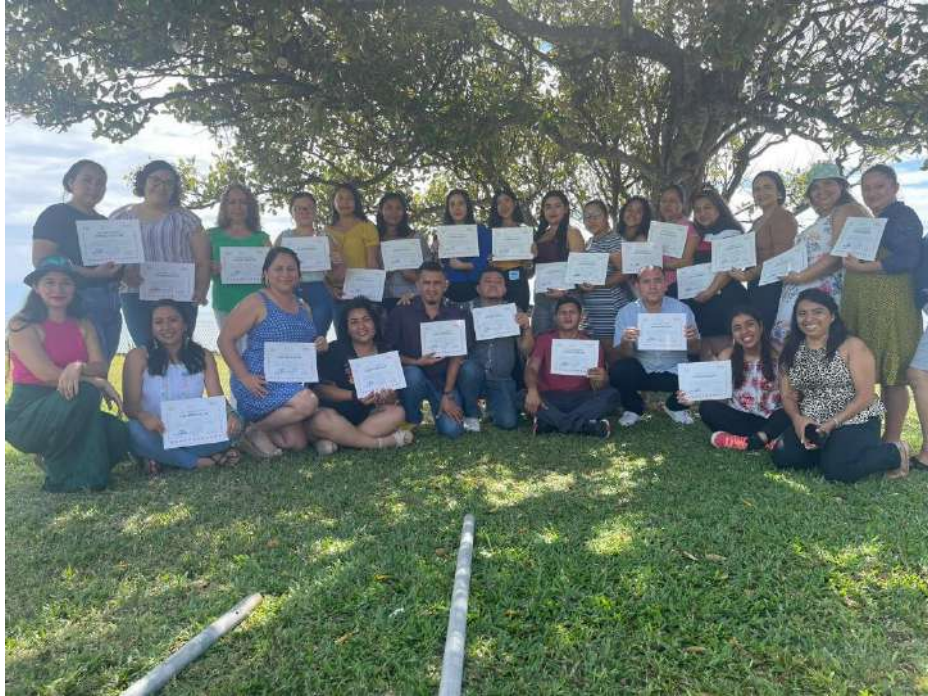
Cierre de proceso formación a formadores con personal de Salud y referentes de puestos informativos.