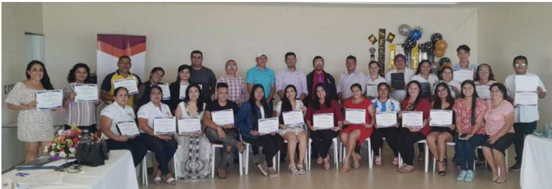
Diplomado construyendo gobernanza y gobernabilidad democrática con enfoque de género en cabañas

M2. Promovidos espacios de articulación, asociaciones y redes entre instancias municipales y nacionales para el impulso de acciones que promuevan la transversalización del enfoque de género en las dimensiones del desarrollo territorial.