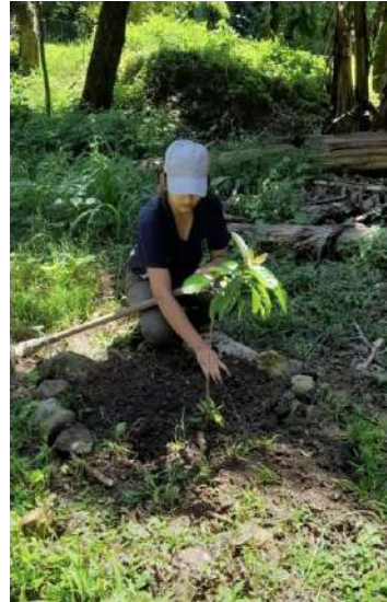
Campaña de reforestación

M3. Propiciados espacios de diálogo e incidencia con instancias públicas para el seguimiento y cumplimiento de políticas que promuevan la defensa de los bienes naturales, la corresponsabilidad de los cuidados y el impulso de programas de desarrollo sustentable priorizando a las mujeres, juventudes y disidencias sexo genéricas.