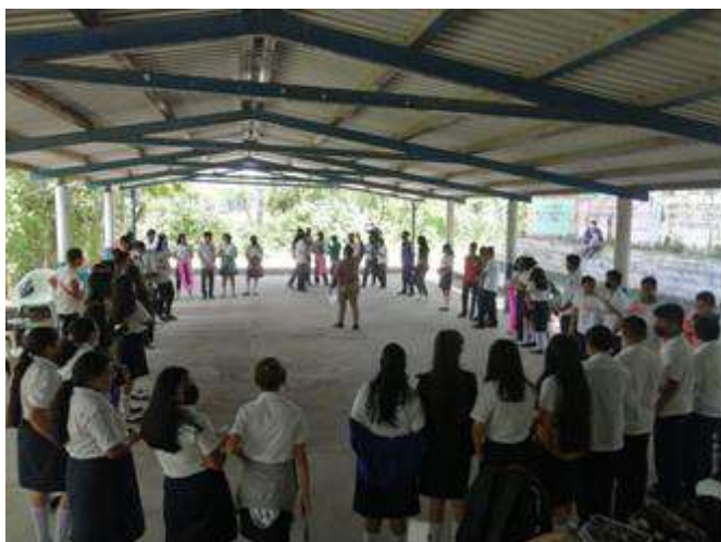
Procesos de formación en EIS en centros educativos

M2. Incidir en las instituciones públicas para el establecimiento y aplicación de la EIS y educación no sexista e inclusiva desde un enfoque positivo, laico y de género.