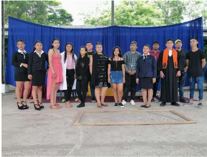
Presentaciones artísticas, jóvenes C.E. Almendros

M3. Ampliando el trabajo y coordinación con personas LGBTIQ+ a nivel nacional e internacional.