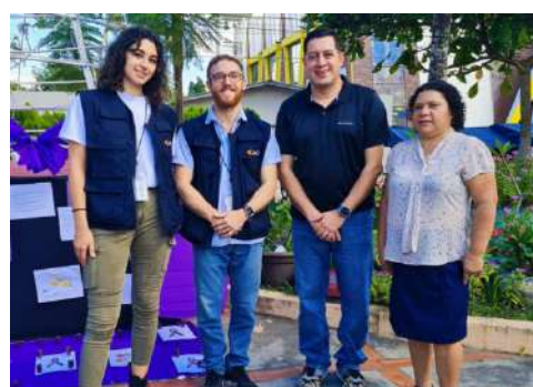
Proceso elaboración y presentación del plan municipal de igualdad y prevención de la violencia contra la mujer (2022-2025)

M2. Promovidos a nivel local y regional, espacios de diálogo, debates, reflexión e intercambios de experiencias de buenas prácticas y aprendizajes de Agenda Municipalista en materia de igualdad de género y Derechos Humanos.