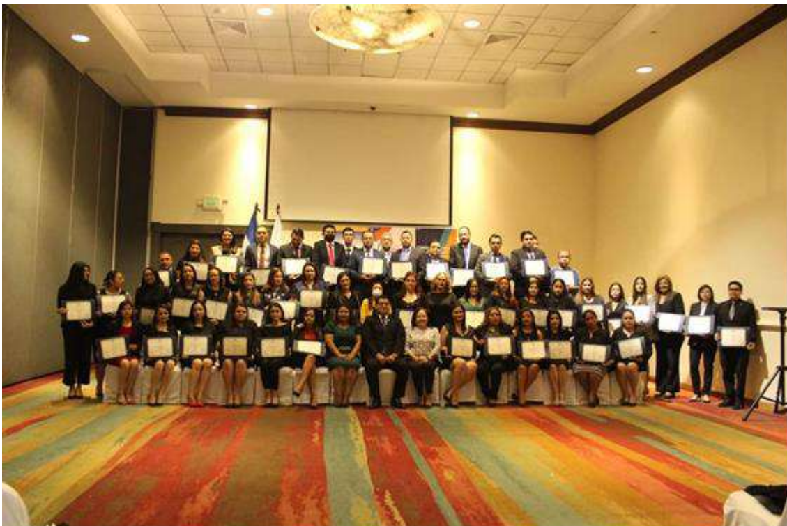
Primer Programa de especialización en Género y Derechos de la Mujer por medio de la Escuela de Capacitación Judicial del Consejo Nacional de Judicatura