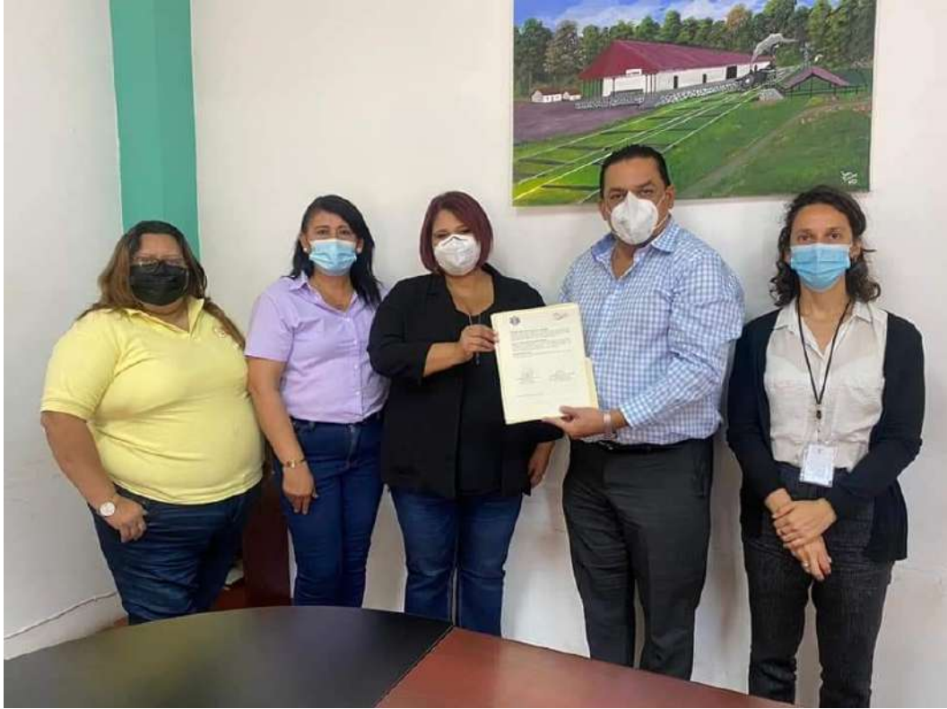
Firma de convenio con municipalidad de Aguilares