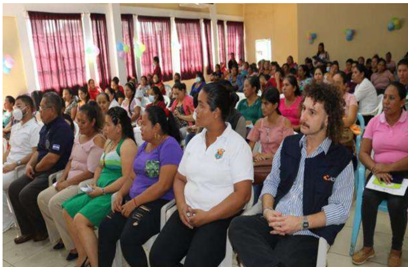
Commemoración del Día Internacional de la Mujer en Jiquilisco